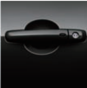
Rojo Supremo Perlado